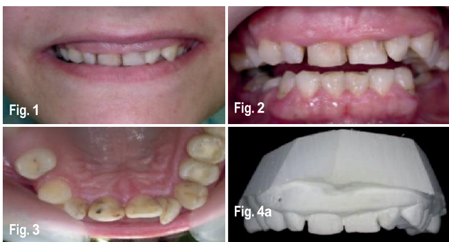
図1、2_高いスマイルラインと、影響を受けた切歯ラインのアウトライン。図3_13番、12番、22番の歯の問題点。および22番の咬合面図。 図4a & 4b_非対称的な歯肉ラインと高いリップライン。

歯冠延長術を長期的に成功させるためには、従来の方法であろうとレーザーによる方法であろうと、また、軟組織の修正のみであろうと骨手術との併用であろうと、生物学的幅径を維持することが重要です。 7